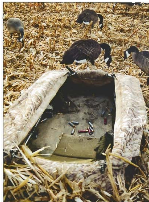
La cache du tireur est intégrée au centre même du dispositif et parfaitement camouflée

L'interdiction des appelants vivants puis celui du plomb, ont donc nécessité cette technique très différente de la nôtre qui repose sur l'utilisation d'une très quantité d'appelants et des caches intégrées au centre même du dispositif. Le but final est de faire venir les oiseaux le plus près pos-